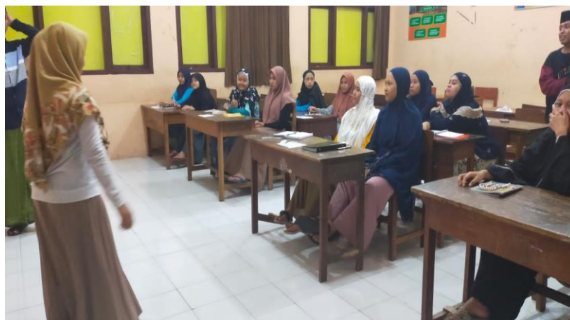
Gambar 4. 10 : Tutor Bahasa Inggris dari Blokagung Sumber : Dokumen Peneliti, Januari 2022

“Dengan adanya ma'had membuat siswa yang menempati di sana merasa aman dan nyaman. Mereka disibukan dengan kegiatan- kegiatan yang membuat mereka lupa dengan rumahnya. Disisi lain kegiatan tersebut tidak ada yang memberatkan mereka. Seperti pengajian kitab klasik, sorogan kibtab, pendalaman bahasa, khitobah dll.