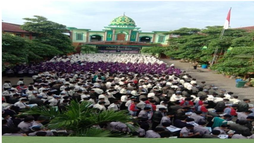
Gambar 4. 1: Sosialisasi Majalah MAKARYA

Dari wawancara tersebut sesuai dengan pengamatan dan dokumentasi yang ditemukan oleh peneliti, memberikan tafsir bahwa dalam sebuah program madrasah tersebut ada bermacam-macam, di MAN 1 Banyuwangi masuk dalam ketegori madrasah literasi.