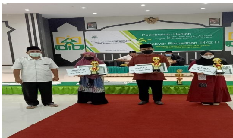
Gambar 4. 6 : Penyerahan Piala kepada Siswa Pemenang Lomba

“Salah satu prestasi yang sangat di banggakan adalah mereka lolos di perguruan tinggi berbeda dengan mereka yang berada dipertengahan ma’had lalu keluar. Adanya bimbingan pembelajaran yang berada di ma’had juga sangat membantu mereka dalam ujian akhir. Tidak hanya itu prestasi lain yang sudah didapat siswa-siswi antara lain: 1). Juara MARS tingkat nasional, 2) MHQ tingkat provinsi di Bangkalan, 3) Banjari mulai dari tingkat kabupaten, provinsi sampai Jawa dan Bali, 4) Telling Story bahasa Arab dan bahasa Inggris, 5) Syarhil Quran tingkat provinsi, 6) Fahmil Quran tingkat provinsi.”