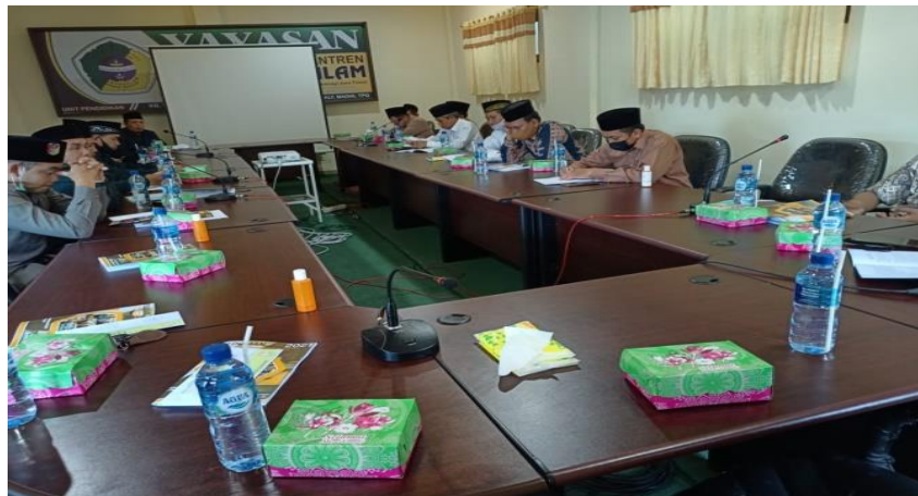
Gambar 4. 8 : Kordinasi dengan Pengurus Pondok Pesantren Darussalam Blokagung, Tegalsari, Banyuwangi