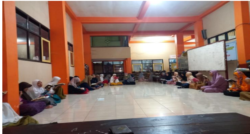
Gambar 4. 3: Kegiatan Setoran dan Muroja'ah Hafalan Al-Quran Sumber : Dokumen Peneliti, Januari 2022

Dari sekian banyak kegiatan yang ada, siswa-siswi wajib mengikuti apabila dari mereka ada yang tidak mengikuti akan diberikan hukuman atau sanksi. Hal tersebut merupakan bentuk agar mereka jera dengan tidak mengikuti kegiatan.