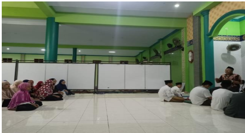
Gambar 4. 2 : Pengarahan dan Pembinaan Kepala Madrasah

meskipun jauh dari orang tuanya dan akan merasa bahwa pengurus dan pengasuh ma'had menjadi pengganti orang tua.