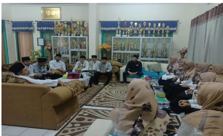
Gambar 4. 9 : Rapat bersama Asatidz dan Kepala Madrasah Sumber : Dokumen Peneliti, Januari 2022

sekolah tidak sembarang dapat menerima ustadz-ustadzah yang masuk, beliau juga mempertimbangkan kompetensi yang dimiliki dari ustad-ustadzah tersebut.