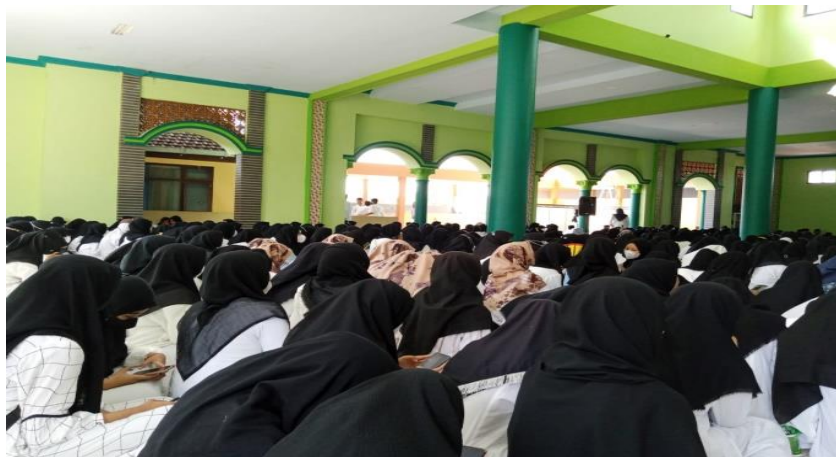
Gambar 4.5 : Kegiatan Peringatan Kelahiran Nabi Muhammad SAW

buta alquran, tulisan arab dan akidah mereka. Dengan adanya khitobah juga mereka agar tau ada bakat mental yang kuat untuk bekal yang di pasarkan di masyarakat. “