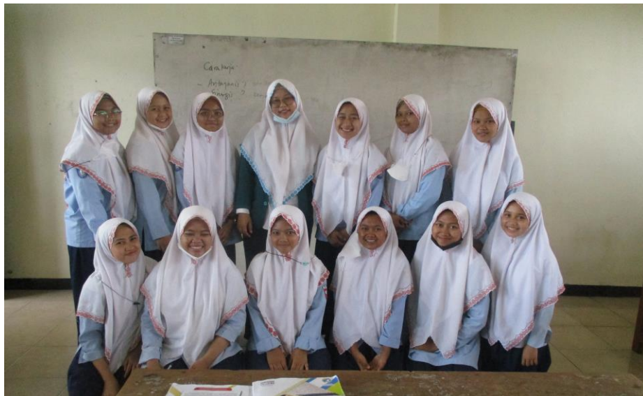
Gambar 4. 1 setelah kegiatan observasi dikelas XI MIA 2

Dan pada 28 maret peneliti melakukan observasi pertama di kelas XI MIA 2. Peneliti hendak mengaplikasikan metode creat sentence dalam meningkatkan hafalan mufradat pada siswa dikelas tersebut. Sebelumnya, peneliti pernah melakukan praktek mengajar di kelas tersebut pada saat PPL. Peneliti meneruskan metode yang pernah diberikan saat PPL dikelas tersebut pada hari itu. Dan saat pembelajaran berlangsung peneliti mengambil materi yang akan disampaikan melalui buku LKS yang disediakan sekolah. Karena di sekolah tersebut tidak ada buku paket.