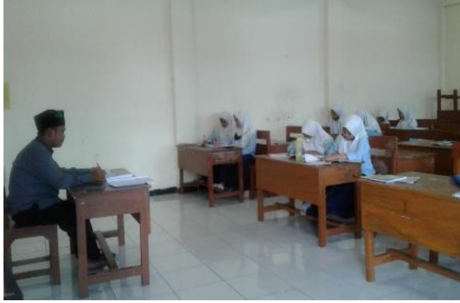
الصورة: تعلم اللغة العربية في الفصل