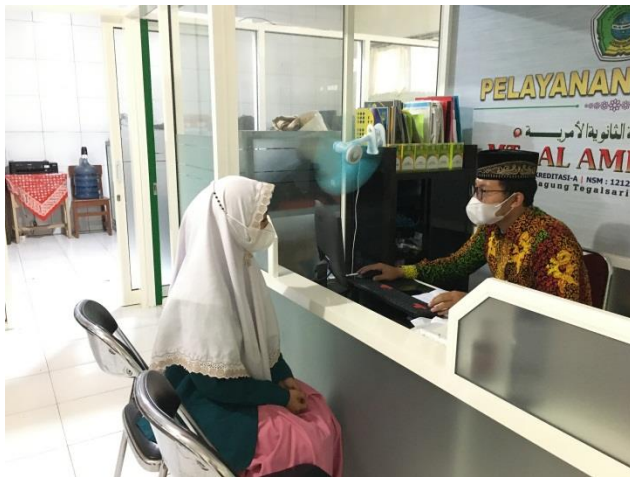
الصورة: يطلب الباحثة رسالة بعد البحث