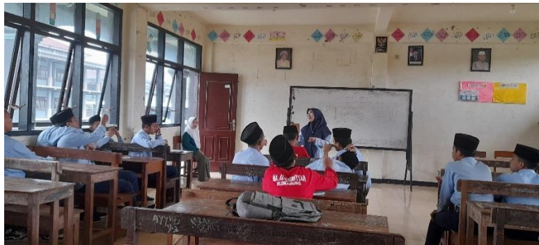
Gambar 4,2 Observasi Dalam Kelas

masuk kelas dengan cara guru memberi tugas pada siswa untuk meringkas deskripsi cerita yang ada di Lks.