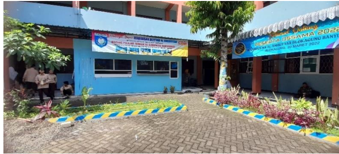
Gambar 4,1 Kantor Madrasah Aliyah Al Amiriyyah

jejang pendidikan tingkat menengah atas di Desa Karangdoro Kecamatan Gambiran yang sekarang ikut dengan kecamatan Tegalsari Kabupaten Banyuwangi dengan pertimbangan bahwa Madrasah Aliyah Al Amiriyyah berada dalam naungan Yayasan Pondok Pesantren yang sangat identik dengan pendidikan islami.