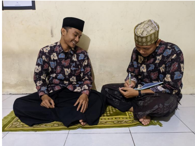
Gambar 4.1 : Wawancara dengan Ketua IHFAD, 2021

Maksud dari wawancara tersebut adalah menjelaskan bahwa kegiatan tersebut berfokus pada pemahaman matan, baik nadzam seperti al-imrithy dan alfiyyah atau natsar seperti jurumiyyah. Program ini berawal dari kesadaran pengurus akan pentingnya pemahaman matan sebagai bekal awal menguasai cabang-cabang pemahaman yang lain. Akhirnya berkumpul tiga serangkai yang terdiri dari ustadz Aly Asyiqin, ustadz Humaidi dan ustadz Hamid. Kegiatan ini sifatnya harian, jadi setiap hari peserta masuk kecuali malam Selasa dan malam Rabu.