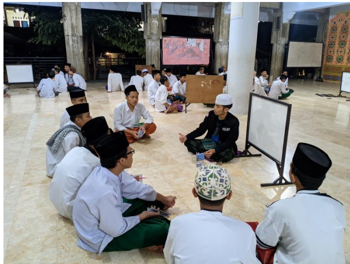
Gambar 4.2 : Kelompok kegiatan IHFAD, 2021

2021 pukul 22.00 WIB di kantor Madrasah Diniyyah Al-Amiriyyah)