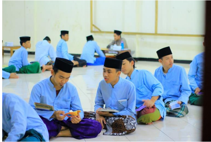
Gambar 4.5 : Evaluasi peserta IHFAD, 2021

“sistem penilaian peserta IHFAD ketika evaluasi digelar dimana dalam satu tahun terdapat empat kali evaluasi. Hal yang ditekankan tidak lain sama dengan standar kompetensi, hanya saja ditambah materi baca kitab sebagai bentuk tathbiq atau praktek menyebutkan syahid dari maqra’ yang dibaca” (Ustadz Muhammad Syamil Basyayif, 1 Juli 2021 pukul 22.00 WIB di kantor Madrasah Diniyyah Al-Amiriyyah)