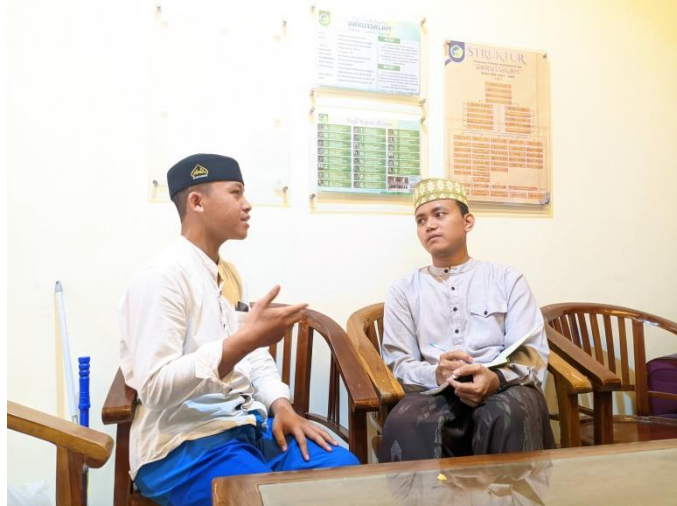
Gambar 4.6 : Wawancara dengan peserta IHFAD, 2021