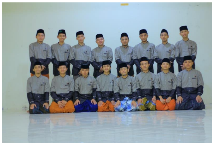
Gambar 4.4 : Dewan Pembimbing IHFAD, 2021

“pembimbing IHFAD adalah orang-orang pilihan yang sudah dirumuskan oleh pengurus melalui seleksi yang ketat. Ada yang dari dewan asatidz dan ada sebagian dari talamidz tingkat ulya” (Ustadz Muhammad Syamil Basyayif, 1 Juli 2021 pukul 22.00 WIB di kantor Madrasah Diniyyah Al-Amiriyyah)